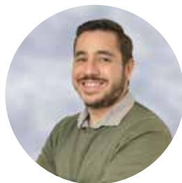
Gabriel Del Castillo

Banquero de inversión. Ocupó cargos directivos a nivel internacional en ABN AMRO, Lehman Brothers, UBS, y SBC Warburg. Economista Senior para América Latina en The Economist Intelligence Unit, periodista económico para BBC World Service. Entre marzo del 2013 y abril del 2015 ocupó el cargo de Presidente del Centro Nacional de Planeamiento Estratégico. Ha completado los programas de prospectiva Foresight Practitioners Training del Institute For The Future en Palo Alto y el Summer Retreat on Strategic Foresight del School of International Futures en Londres . Actualmente es Gerente General de Europa Partners y columnista del Diario Gestión.